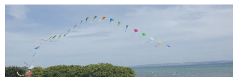
Forside / Skabelon